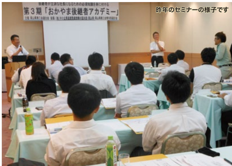
昨年のセミナーの様子です

事業承継計画の策定からIT活用・ 財務・広報・リーダーシップ・社内活性化 まで、講師陣が分かりやすく伝授！